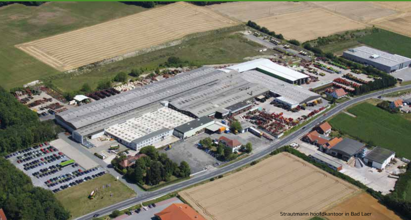
Strautmann hoofdkantoor in Bad Laer

De onderneming B. Strautmann & Söhne GmbH u. Co. KG is een middenstandsfamiliebedrijf in het district Osnabrück dat nu na een ruim 80-jarig bestaan in handen is van de derde generatie. Op de tweede productie-locatie in Lwówek (Polen) produceert Strautmann in een moderne fabriek naast afzonderlijke machinecomponenten ook delen van het machine-