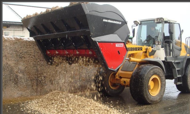
Bietensnijder aan wiellader

Snel en eenvoudig bietensnijden met tractor, wiellader of kniklader