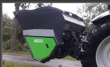
Uitvoering in de hefinrichting